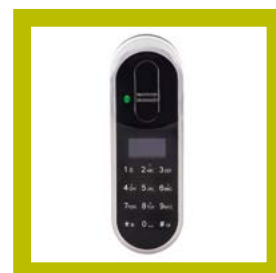
Lecteur Touchpad+ (code et empreinte digitale)