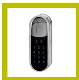
Lecteur Touchpad (code)